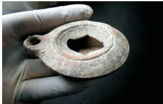
Lâmpada dos tempos bíblicos.

Repare no detalhe: todas elas acabaram dormindo. Ficaram desatentas, e cochilaram. A diferença entre elas era o suplemento extra de azeite que cinco delas haviam trago. Portanto, a questão não era apenas de vigilância, como bradam os pregadores, mas de prevenção e prudência. Ser prudente aqui, é ser precavido. ►